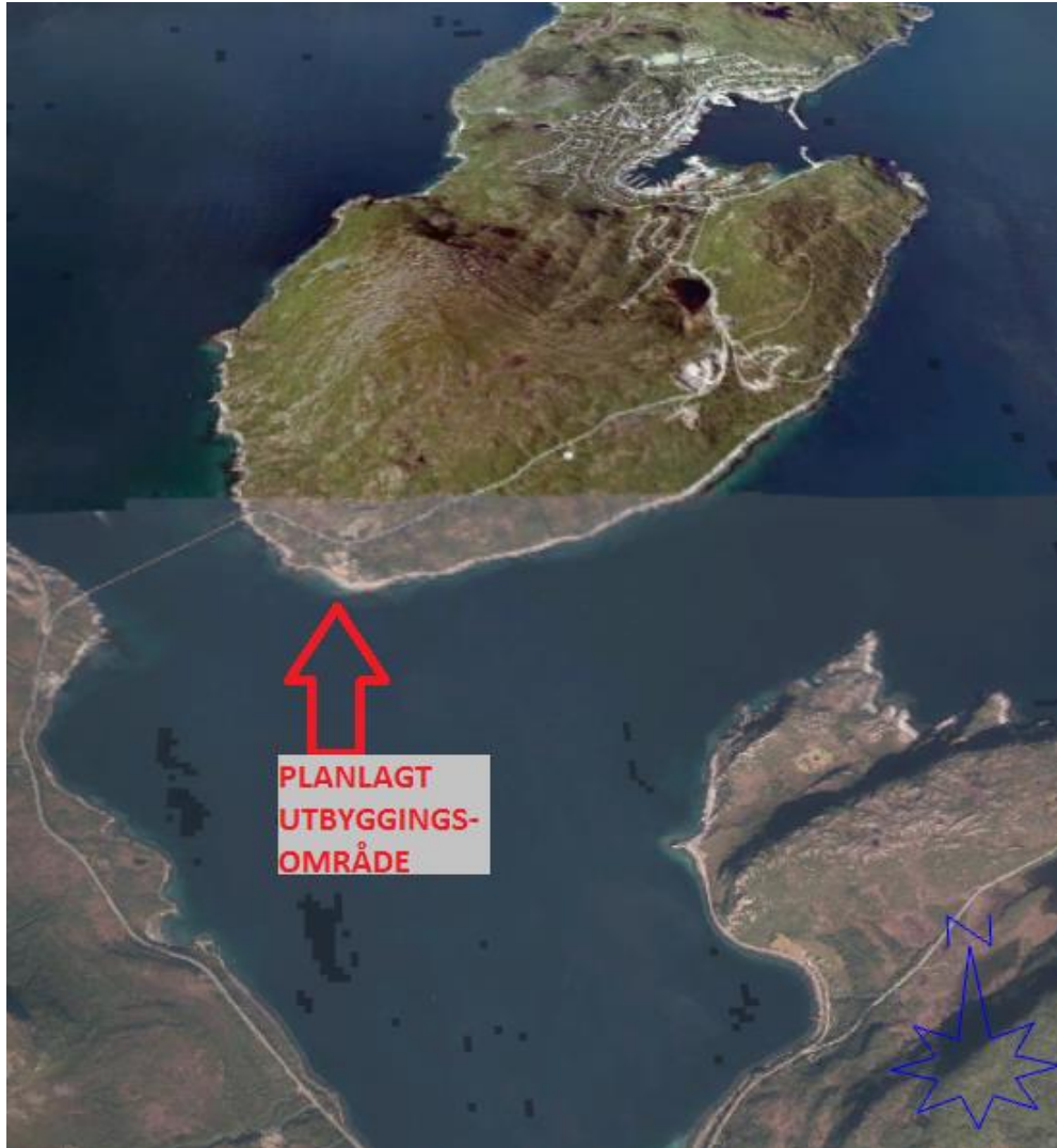
Figur 2. Lokalisering av planlagt utbyggingsområde

Reguleringen skal legge til rette for oppføring av et større settefiskanlegg for mer enn fem millioner settefisk på deler av området, mens området vest for den eksisterende adkomstvei til grustaket i sin helhet reguleres til havbruksrelatert industri.