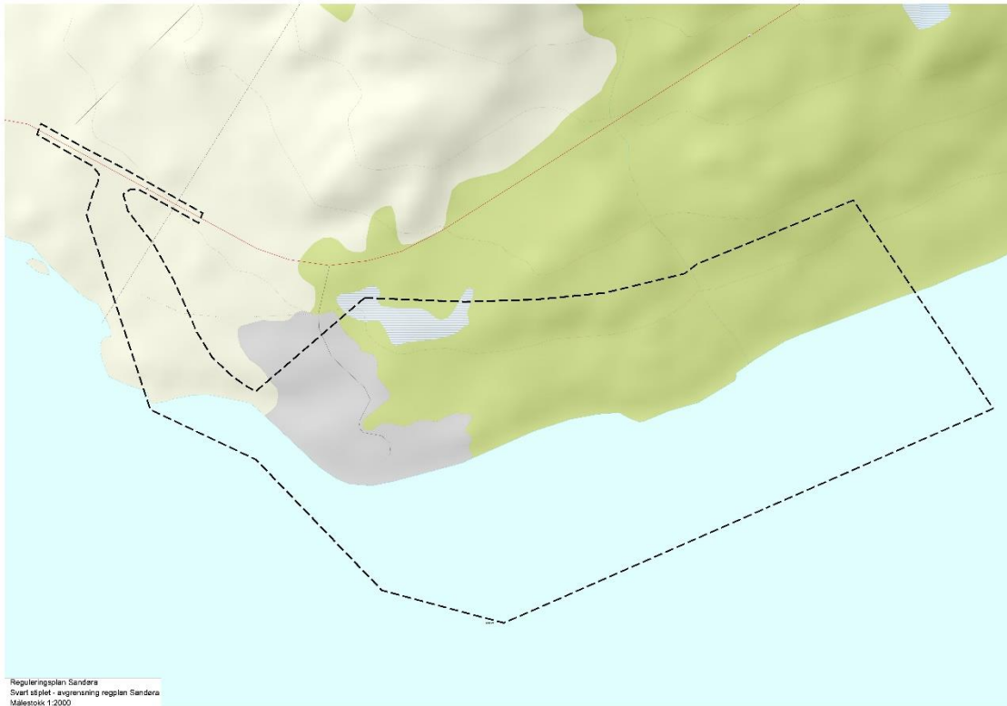
Figur 4. Planavgrensning