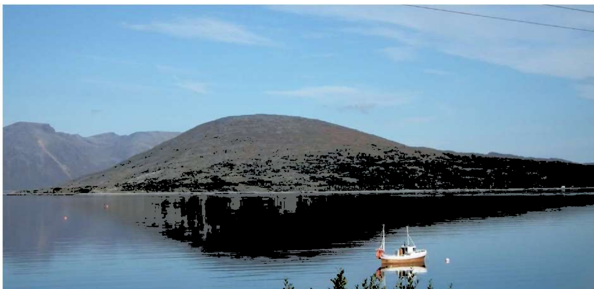
Figur 1: Oversikt over planområdet. Steinalderlokaliteten ligger på det grønne partiet til høyre for neset til venstre i bildet.

Planen ble sendt på offentlig ettersyn i mai måned 2014. Det ble bedt om utsatt svarfrist for å fullføre undersøkelser etter § kulturminnelovens § 9. Vår uttalelse foreligger i brev datert 15.10.2014. Planen var i konflikt med kulturminnelovens bestemmelser, fordi kulturminnelokalitet ID 56821 lå innenfor areal regulert til vegformål. På bakgrunn av dialog med Statens vegvesen ble det gitt innspill til endringer av planen for å unngå konflikt. I hovedsak var dette bestemmelser om forbud mot anlegg og kjøretøy sør for fylkesvegen der kulturminnet befinner seg, kombinert med regulering til av kulturminnet til hensynsone d). Implisitt i dette var også at breddeutvidelsen av vegen skulle skje inntil eksisterende veg på nordsida. Våre innspill ble skriftlig akseptert fra vegvesenets side i brev av 21.10.2014. Senere har planlegger påpekt at det vil være vanskelig å drive anlegg forbi kulturminnet uten å komme inn i sikkerhetssonen som er i vegkanten. Planlegger har også påpekt at det er uheldig om hensynssonen kommer inn i på vegen - i et område som normalt ville vært regulert til vegformål. Vi er enige i denne vurderingen og ser faren for at enkeltminne 1 og 2 i lokaliteten kan skades som følge av utbedringen.