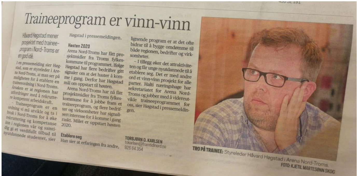
Bilde: avisutklipp fra Framtid i Nord 21.01.2020