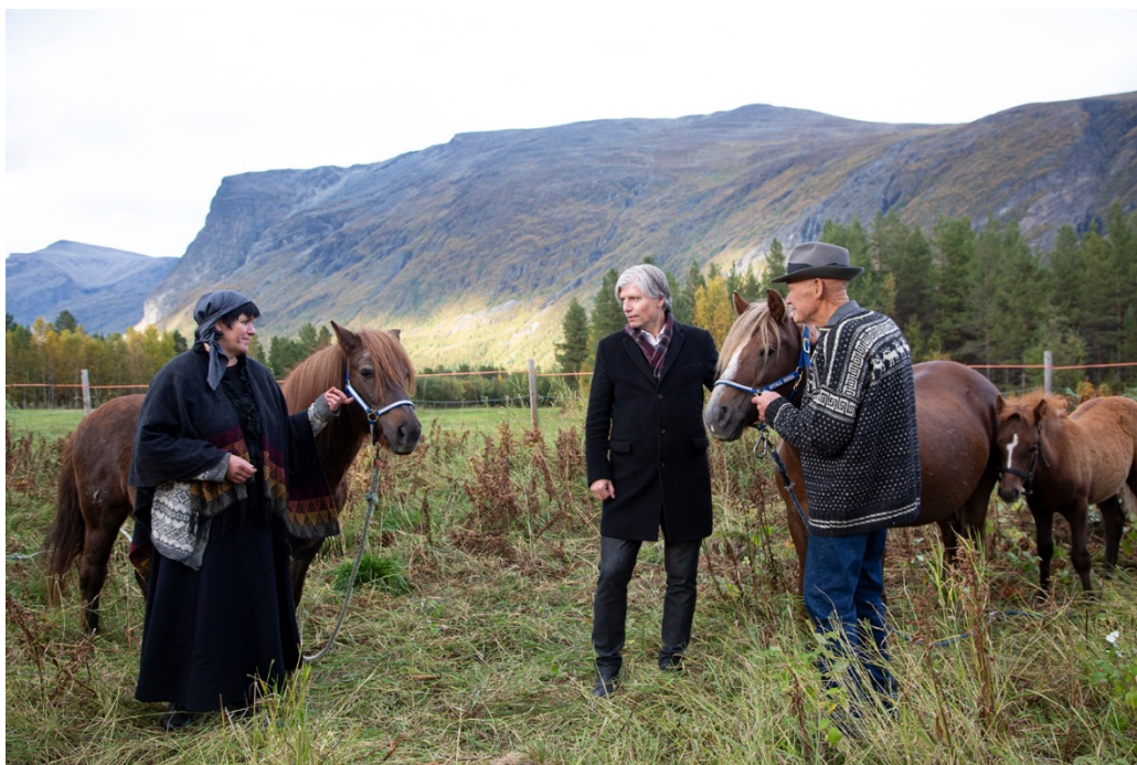
Fra Tørfoss under fredningsarrangement høst 2019, med daværende miljøminister Ola Elvestuen.