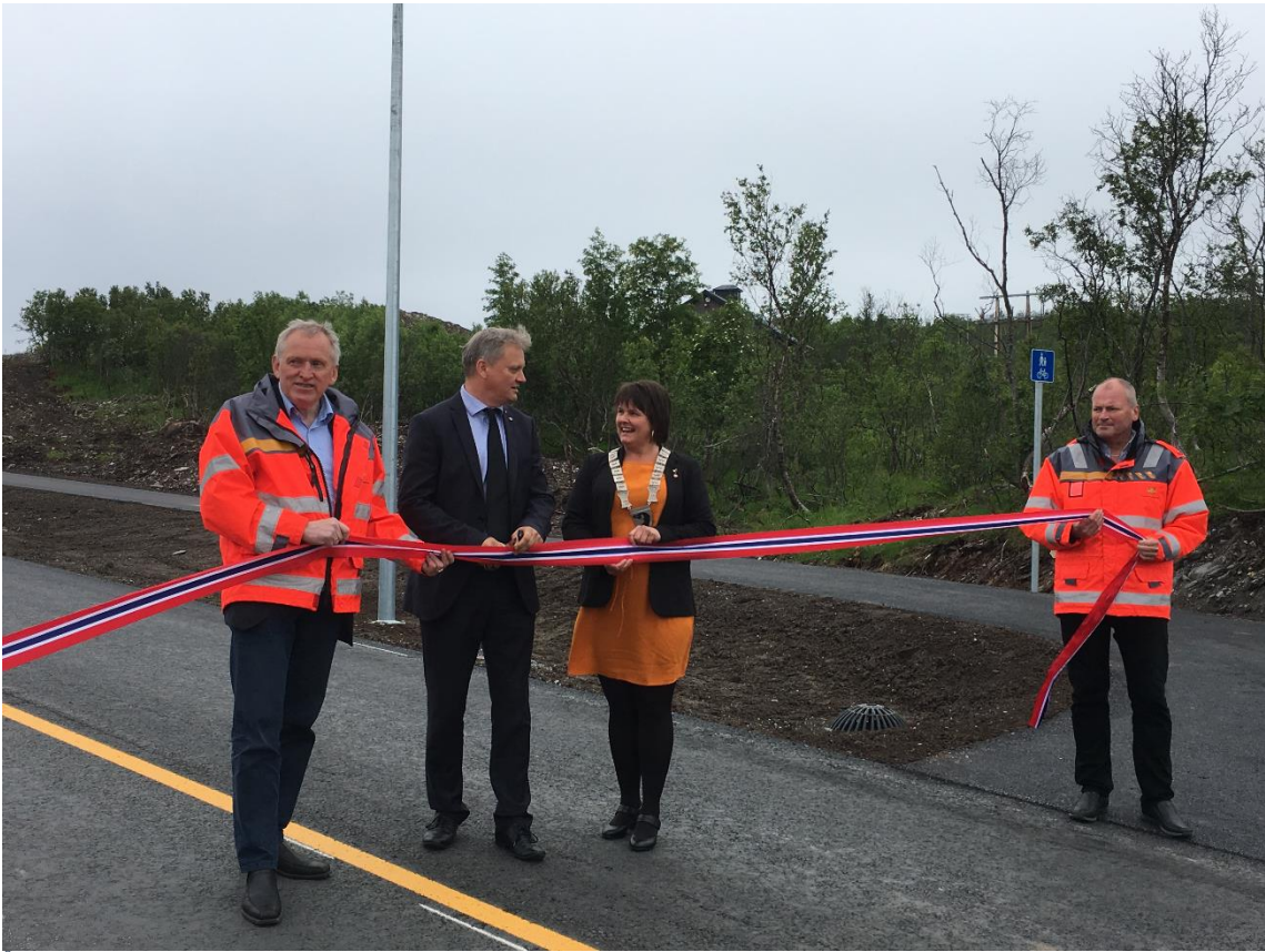
Åpning av ny innfartsvei til Skjervøy, 4. juli 2018, foto: Cissel Samuelsen