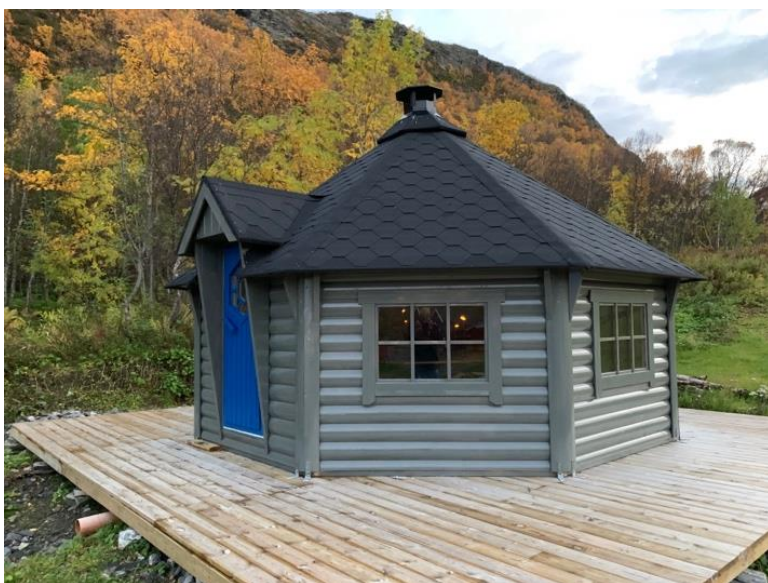
Denne står i Sandvågen, Skjervøy