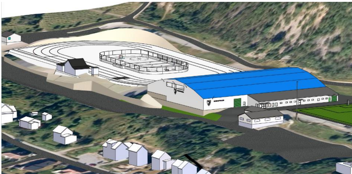
Tidlig illustrasjon som viser planlagt bygg. Illustrasjon er ikke juridisk bindende (Pål Pettersen, Forprosjektet)

Ny treningshall er planlagt oppført mellom den gamle og den nye kunstregressbanen på stadion. I dag står klubbhuset hvor den nye treningshall skal plasseres. Treningshallen skal oppfylle kravene for en 9-erbane med bredde, lengde og høyde. Det legges til rette for en treningshall på ca 80x50m og ca 14 m i høyden. Treningshallen er i gangavstand fra barne- og ungdomsskolen. Det viktigste hensynet er å legge til rette for at barn og unge skal trives i området. Treningshallen skal oppføres i stål. Treningshallen hovedvolum skal utformes med skråtak og lyse fasader med innslag av detaljer i blått. Arealet nærmest Trollveien skal avsettes til parkering og arealet mot kirkegården skal avsettes til skråparkeringsplasser.